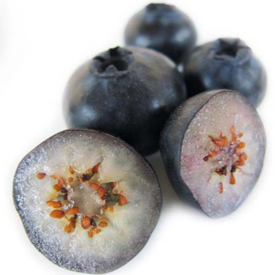
Cross-section of a cultivated blueberry