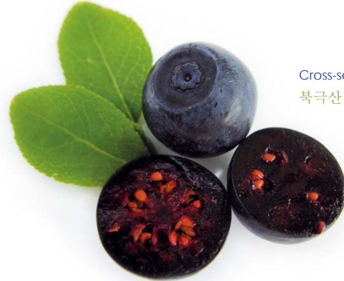
Cross-section of an Arctic bilberry